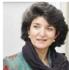
SANDRA PRALONG Staatsberaterin im Rahmen des Präsidentenamtes